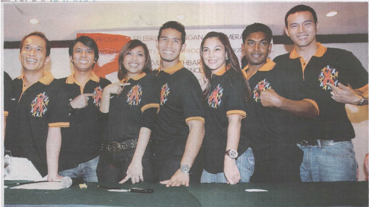
MISI pertama selebriti yang terlibat dalam program ini adalah mengurangkan stigma dan diskriminasi terhadap mereka yang dijangkiti atau terlibat dengan HIV/AIDS.